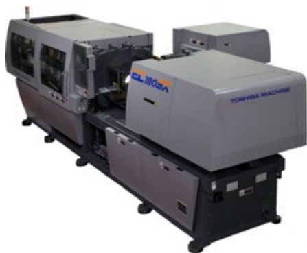
全電動式の多色成形機（芝浦機械）

多色成形技術を利用したこだわりの商品として、最も多いのが玩具などのプラモデルです。昔は単色で、部品を組み立て後に塗装をされたかと思いますが、今では最大で四色成形のものまで販売されており、最近では塗装の必要性もなくなりつつあります。商品としての外観品質も向上しました。使用する金型も色の分だけ必要でしたが、 多色成形機により金型1つあれば製作 できるようになりました。